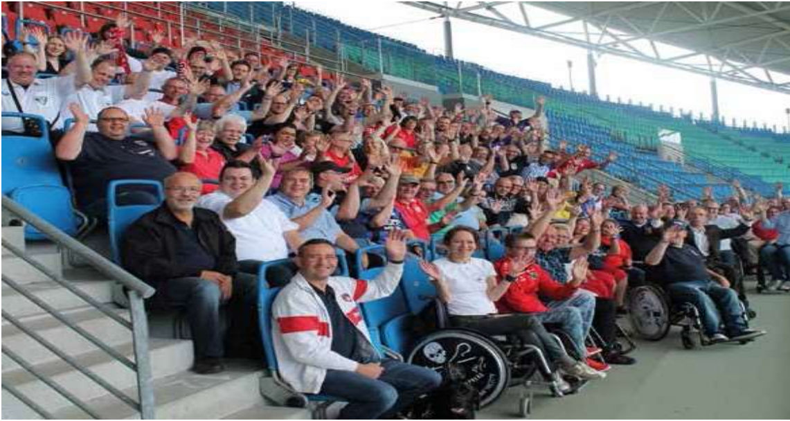
• Fotografija navijača s invaliditetom na Leipzig Areni

Uloga ČGI-a pokriva široko područje djelatnosti, s fokusom na vrhunsku pristupačnost i uključivanje a kako bi se osiguralo da osobe s invaliditetom imaju iste prilike kao i svi drugi za uživanje u nogometu, mogućnosti koje mnogi uzimaju zdravo za gotovo.