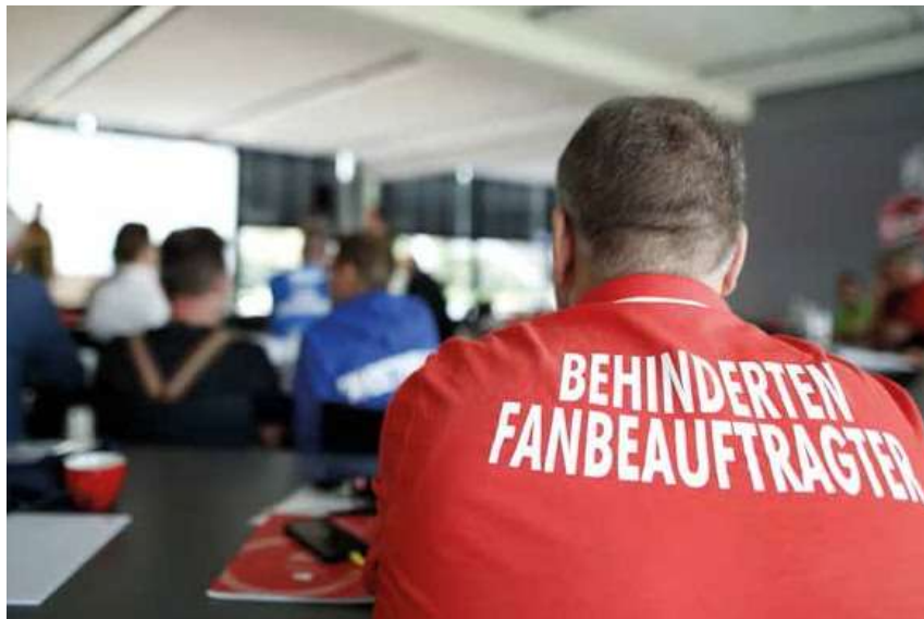
❖ ČGI na Skupštini Časnika za gledatelje s invaliditetom 2017., Cologne, Njemačka

Uvođenje ČGI-a promijenilo je nogometnu okolinu, tako da je stvorilo uključivo okruženje koje reflektira šire društvo. Članak 35bis UEFA Pravidnika o licenciranju klubova i financijskom fair playu rezultirao je većom posjećenošću utakmica uživo od strane navijača s invaliditetom, većom osviještenošću o invaliditetu unutar nogometnih dionika i da sve više osoba s invaliditetom uzima mjesto koje im pripada u svijetu nogometa – bilo kao gledatelji, igrači, volonteri, treneri, administratori ili donosioci odluka.