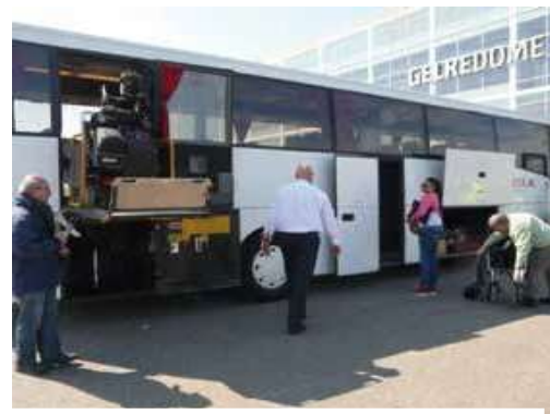
❖ Pristupačan autobus u Gelredome, Arnhem