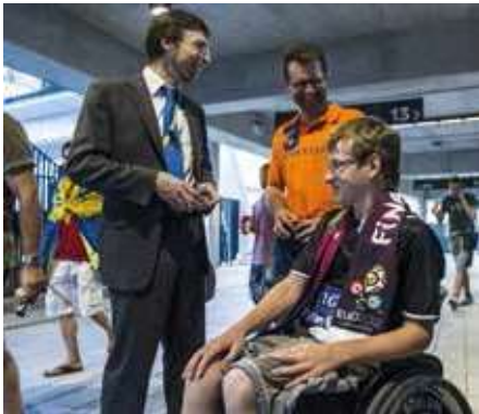
❖ Korisnik invalidskih kolica na NSK Olimpiyskyi, Kyiv, UEFA EURO 2012.