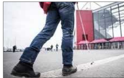
❖ Taktilno označavanje na Opel Areni, Mainz