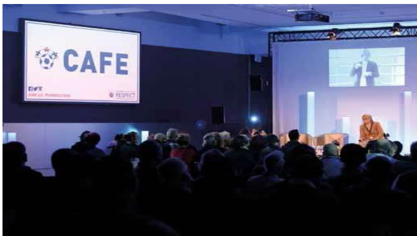
• Druga Međunarodna CAFE Konferencija na Stade de France