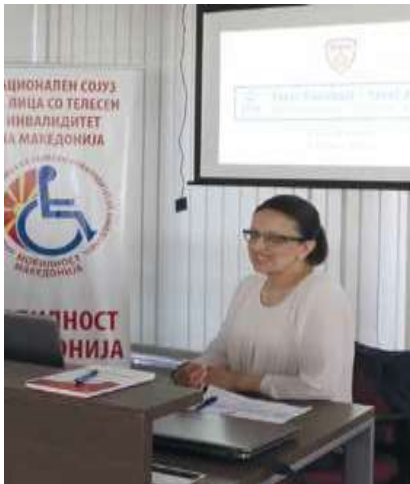
• Govornik na ČGI radionici organiziranoj Od strane Nogometnog saveza Makedonije