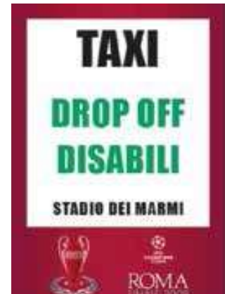
❖ Oznaka koja označava pristupačno mjesto za iskrcaj na finalu Lige Prvaka 2009 u Rimu