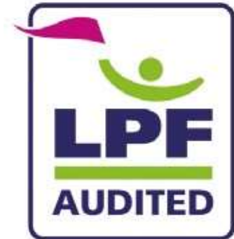
• Pečat koji označava da je stadion pregledan od strane Level Playing Field