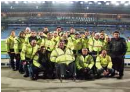
❖ Uključiva skupina redara utakmice

Jasno je da pristupačni sportski stadioni i dan utakmice ekonomski korisni, prilagodljivi iz funkcionalne perspektive i održiviji. Svi pobjeđujemo kada je pristup bolji.