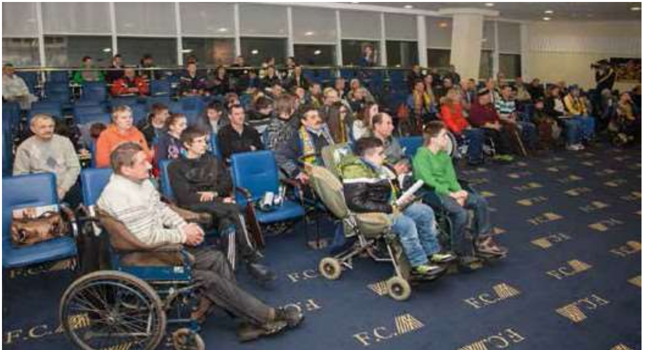
❖ Navijači s invaliditetom okupljeni na sastanku u Metalistu Kharkiv, Ukrajina