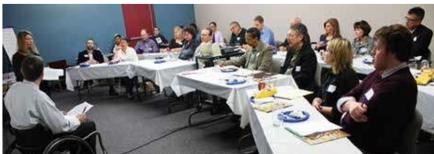
• Klupsko osoblje na treningu podizanja svijesti o invaliditetu