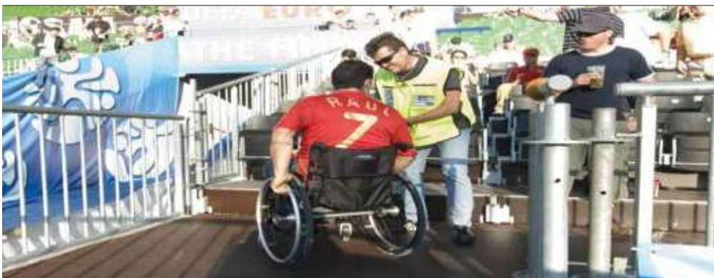
❖ Redar razgovara s korisnikom invalidskih kolica, Ernst-Happel stadion, Beč, UEFA EURO 2008. Finale